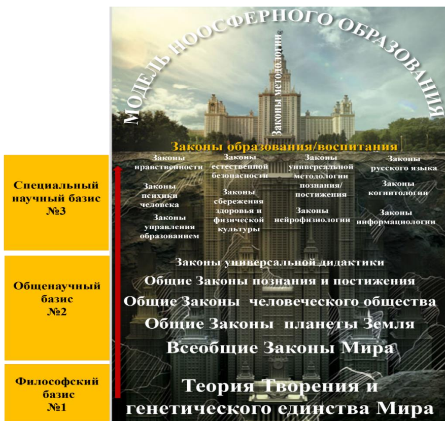
Схема №6. Модель системы ноосферного образования.

психики учащихся в ходе учёбы) и принцип потенциальной информационно-интеллектуальной безопасности (использование средств, методов, информации не способных нарушить нормы биоритмов системы «человек» в любом отдалённом от момента учёбы периоде жизни).