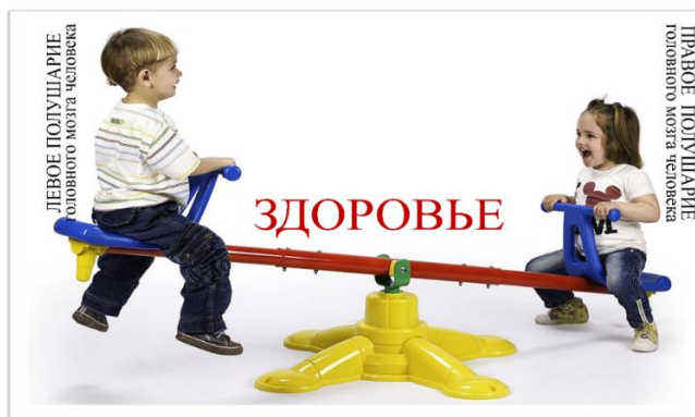
Схема №3. Образ биоадекватной методики преподавания учебных дисциплин.

Биоадекватная методика 1 – это реализуемая на практике совокупность скоординированных действий учителя и ученика с задачей мотивации индивидуальных моделей информации и работы с ними на основе специальных законов психики, здоровья человека и законов образования в достижении учебных целей. При такой интеграции естественных усилий ученика и учителя исключаются излишние операции на уроке. Происходит экономия времени, физических, психических, энергетических, когнитивных затрат. Нормативность биоадекватной методики обоснована природосообразной методологией ноосферного образования. Именно этот метод обеспечивает человека адекватной и натренированной в годы школьной учёбы моделью целостного мышления. Эта модель применения двух полушарий в обработке информации на основе включённости в познание 5 - 6 каналов её восприятия. Осознанное, систематическое применение ассоциативных образов во всех дисциплинах школьного цикла создаёт целостно – системное ассоциативное природосообразное мышление.