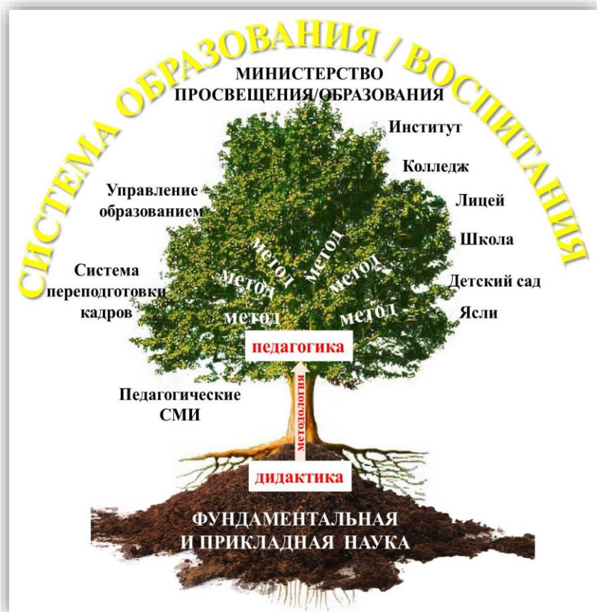
Схема №2. Древо педагогики.

Образная схема №2 показывает взаимосвязи системы образования с Законами Мира и планеты Земля, фундаментальной и прикладной наукой с базовой педагогической наукой – дидактикой. Она интегрирует необходимые для учебно-воспитательной деятельности лучшие наработки прошлого и современности. На этой основе формируется «ствол педагогического древа» – методология, рождающая его «крону»: практическую педагогику с её технологией, методами, а также организационную систему образования (ясли, детсады, школы, лицеи, колледжи, институты, управлением образования, системой переподготовки кадров, министерством и др.).