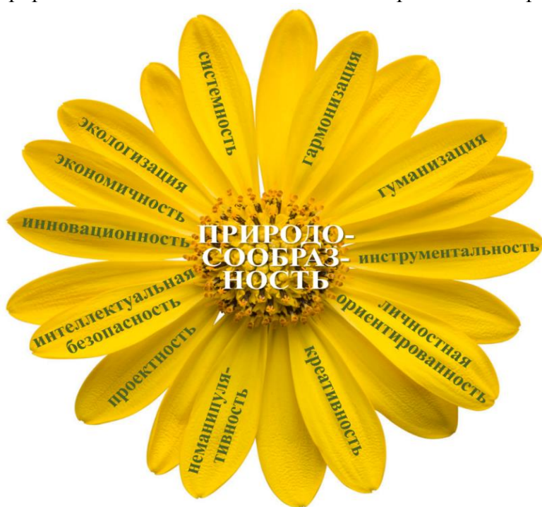
Схема №1. Системообразующий принцип ноосферного образования – природосообразность.

В природосообразной педагогической парадигме Ученик и Учитель впервые рассматриваются как открытые системы , воспринимающие и передающие волновые сигналы природы, общества, человека, техники. Работая в режиме слабых информационных взаимодействий (слово, мысль, чувство), человек обретает знания, умения и навыки, интегрирует целостность психики, укрепляет лучшие принципы духовности и нравственности, формирует мотивы социальной реализации и направленность, к счастью, жизни и