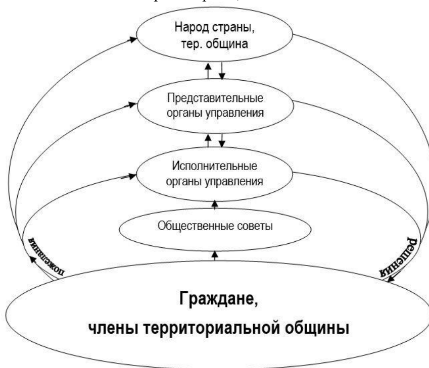
Рис. Общая схема общественного самоуправления

Народовластие реализуется на всех уровнях территориальной самоорганизации граждан, начиная с территориальной общины многоквартирного дома или улицы в частном секторе до общегосударственной общины – народа страны, согласно общей схеме самоуправления: